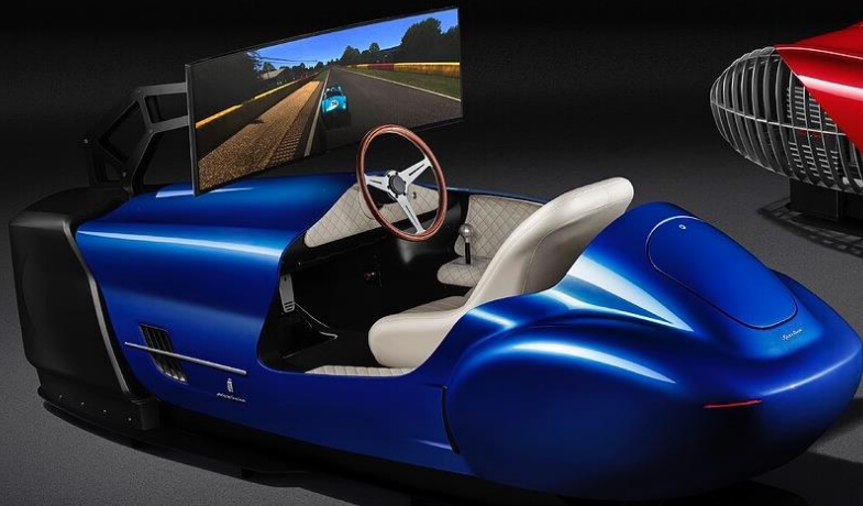
TCCT eClassic Simulator Collector Edition "Pininfarina Sportiva"