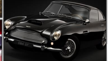
Aston Martin DB4GT