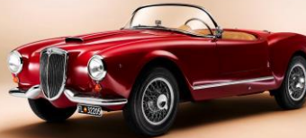
Lancia Spider America