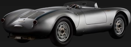
1956 Porsche 550 Spyder VIN #550.0084