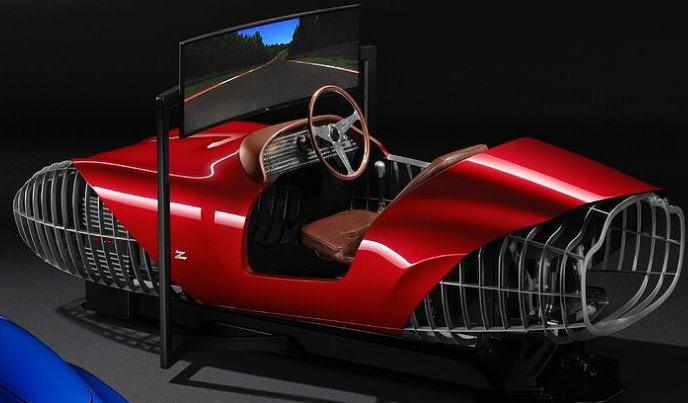
TCCT eClassic Simulator Collector Edition "Zagato Elio Z"