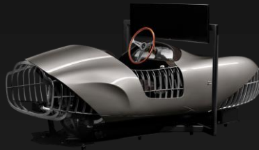
Zagato eClassic Simulator "Elio Z"