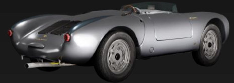
1956 Porsche 550 Spyder VIN #550.0084 Zertifizierte digitale Version